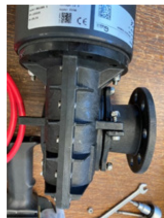
Fig. 6. Motorn kan nu monteras åt motsatt håll utan att växelhushus eller motor tar i akterspegeln