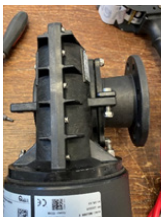
Fig. 4. Kompositväxelhushus med anslutningsstos.

Anslutningsstosen kan enkelt monteras loss från växelhuset och monteras på motsatt sida. På så sätt kan motorn och växelhuset på de nya spelen alltid monteras rakt upp eller rakt ned oavsett modell. Anslutningsstosen monteras loss från växelhuset genom att lossa 4+ 1 bultar varefter den vänds runt och monteras på samma sätt på växelhusets motsatta sida (se fig. 4-6).