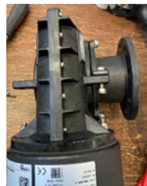
Fig. 2. Nya växelhuset i komposit. Anslutningsstos flyttbar.

Motor-växellådsmonteringen är från fabrik identisk på X- och Y-spel. För äldre spel med aluminiumväxelhushus innebar detta på grund av växellådans utformning att X-spel inte kunde monteras med motorn rakt upp och Y-spel med motorn rakt ned vid akterspegelsmontering, se fig. 3: