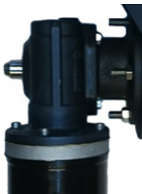
Fig. 1. Gamla växelhuset i aluminium. Anslutningsstos ej flyttbar.

När Balderspelen kommer från fabrik är motorn hopmonterad med växelhuset. På spel tillverkade före 2022 var växelhuset gjort av aluminium på alla modeller. Från 2022 är växelhusen på 600 och 900 gjort av komposit, se fig. 1 och 2.